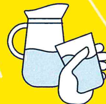
BUVEZ DE L'EAU